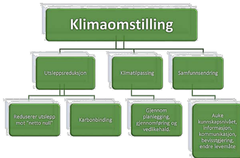
Figur 1: Viser prosesser omfatta av omgrepet Klimaomstilling.

av klimaomstillinga samfunnet vårt må igjennom, saman med utsleppsreduksjon og samfunnsending, illustrert i figur 1 som er henta frå regional plan for klimaomstilling (3).