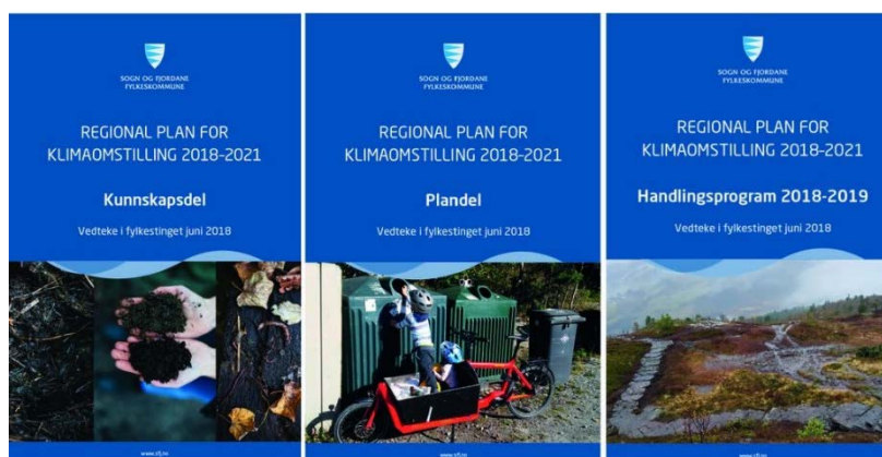
Figur 4: Framsidene på dei tre nye delane i den regionale planen for klimaomstilling frå 2018.

Sentrale føringar og forventningar til kommunane si planlegging, arbeid med klimatilpassing og næringsutvikling vert utarbeidd av fylkeskommunen. Sogn og Fjordane har nyleg utarbeidd tre nye plandokument for klimaomstilling (3, 10, 15). I desse planane er klimatilpassing, klimakunnskap og klimakommunikasjon, næringsliv og teknologi tre av dei åtte prioriterte plantema for klimaarbeidet til fylket (3). I regional planstrategi frå 2016 vert klimaendringane nemnt som ein av dei fem viktigaste utfordringane for fylket (16).