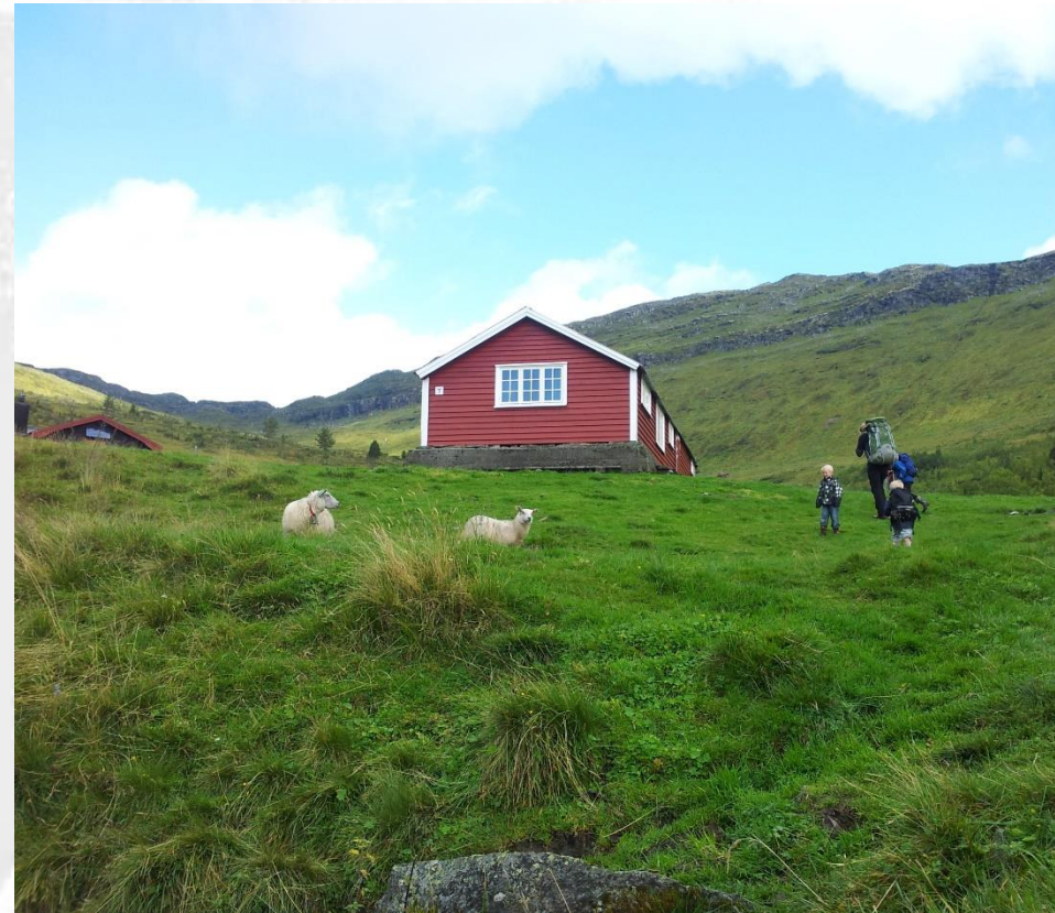
Navarsetestølen